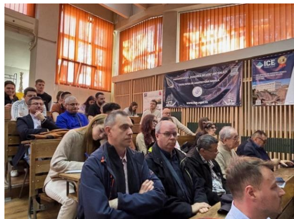
Aspecte din amfiteatru