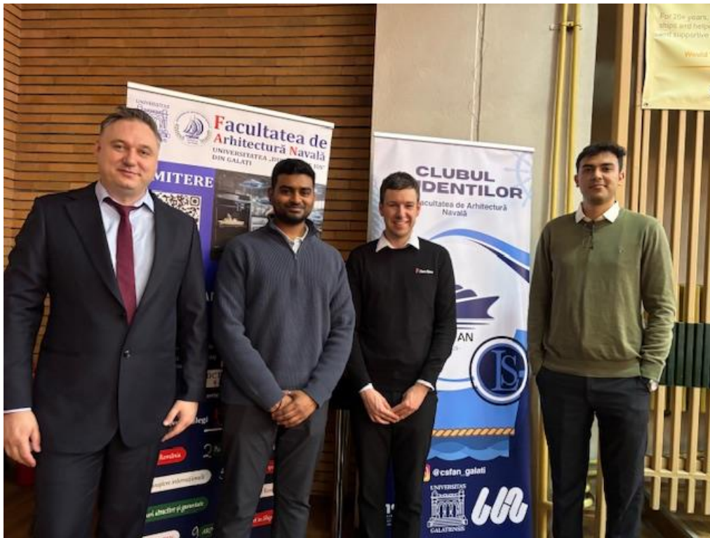
Echipa Allewijnse Marine